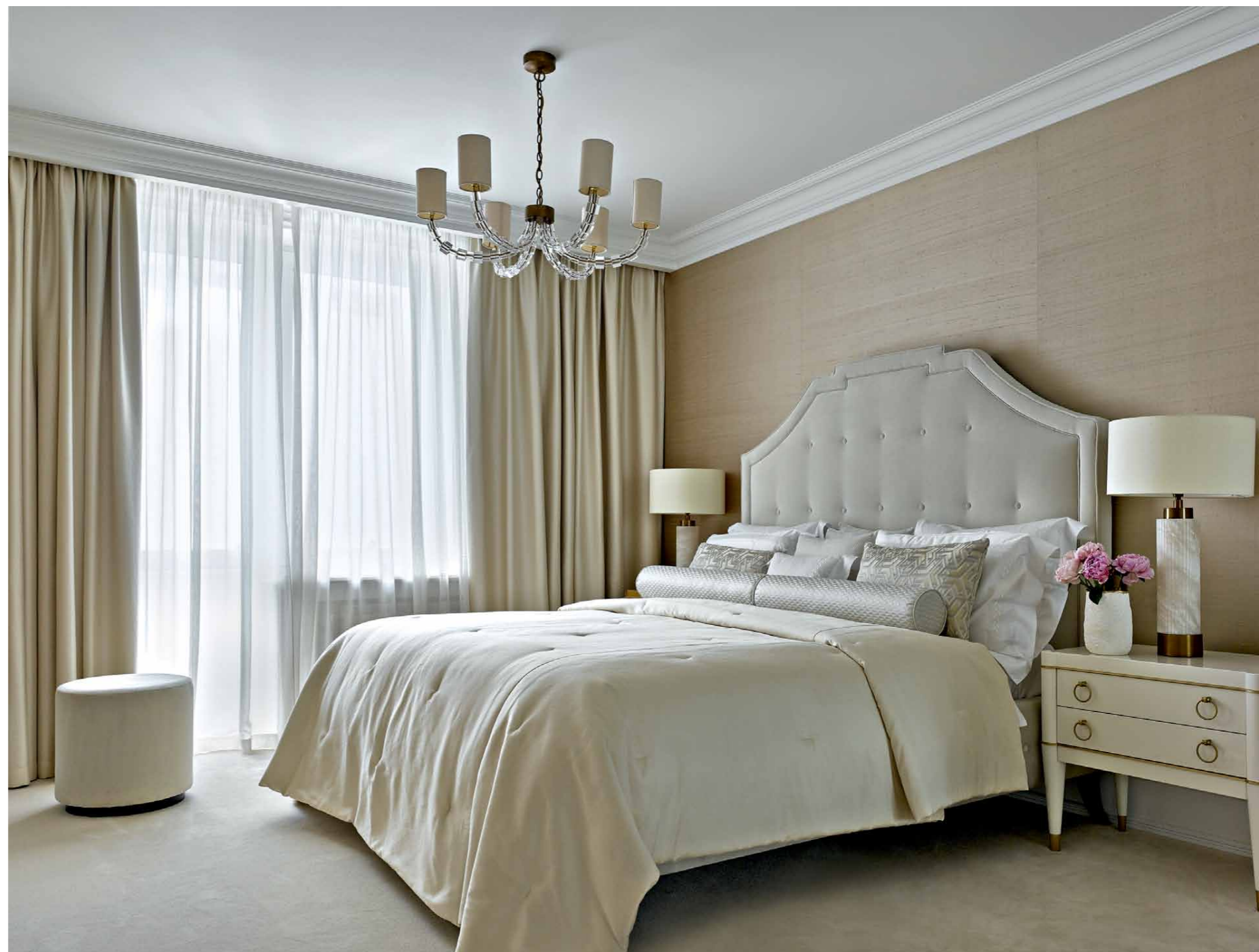
В просторной прихожей разместили большой встроенный шкаф для хранения вещей, благодаря чему здесь нет ничего лишнего, стоит только элегантное маленькое кресло (MERIDIANI). Справа Спальня выдержана в серо-бежево-белой гамме. Шкафы не загромождают её, они находятся в прилегающей к спальне гардеробной. Кровать, SOFTHOUSE. Лампы, HEATHFIELD. Текстиль, DEDAR, HERMÈS